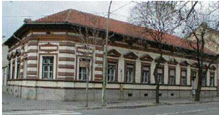
1883-ban épült tégláépület

Óvodánk 1959-ben nyitotta meg kapuit. A több mint 60 éves múltra visszatekintő intézmény évtizedeken át a MÁV üzemi óvodájaként, majd 1994 februárjától „A Vasút a gyermekekért” Alapítvány fenntartásában működik Szegeden, a belváros szélén, a Belváros és Alsóváros találkozásánál. Környezetünkben és programjainkban a hagyományok tisztelete és a modern szemlélet optimálisan ötvöződik.